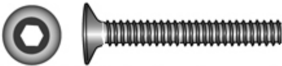
DIN 7991 Senkschraube